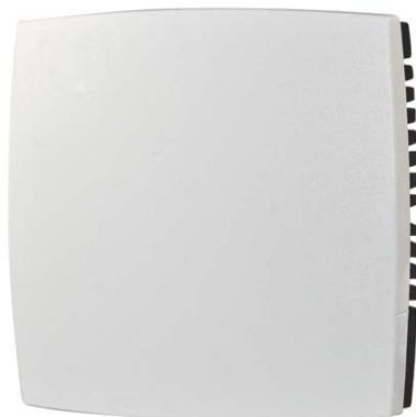
Wygląd urządzenia może odbiegać od przedstawionego na ilustracji. Dane techniczne mogą ulec zmianie.

Do zastosowań w instalacjach wentylacyjnych i klimatyzacyjnych